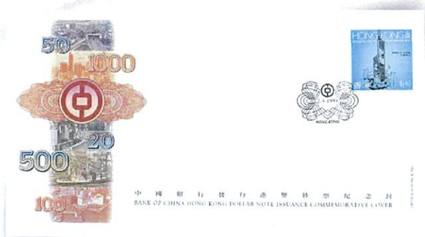
1994年5月2日，中國銀行發行港幣鈔票紀念封

經歷了1985年新中銀大廈建築時期、1989年風波事件、1990年遷入新大廈前後過程、1994年首次在港發鈔、1990年及1994年為慶祝新大廈和發鈔通過郵政署發行同款郵票的首日封、1997年慶祝歷史性的香港回歸等，港中行承擔大部分新大廈景點的參觀與接待工作，以及圓滿完成2001年中銀集團歷史性合併的準備任務等。2001年9月11日晚，港中行舉行了約有1,500多人參加的全行大聚會，這也成為港中行時期最後一次、最大規模、最讓港中行人難以忘懷的活動。