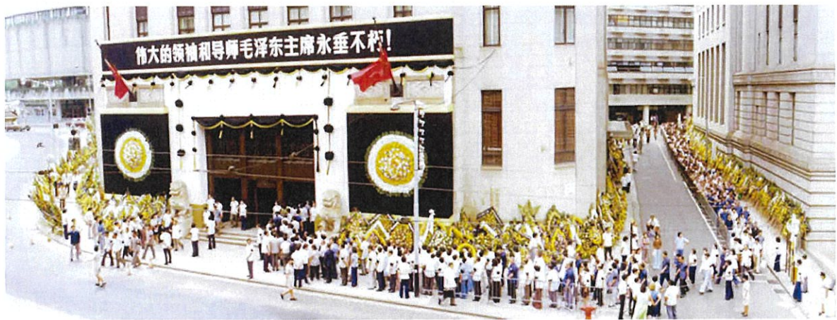
1976年9月18日，在中國銀行大廈為毛澤東主席舉行追悼會時致祭人士排隊等候場景