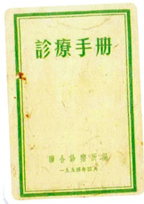
1954年4月聯合診療所編印的《診療手冊》（圖左），1981年11月聯合診療所簽發給員工的診療證（圖右，反面）

在港中行時期，行方很少以外判方式解決後勤工作，因此，港中行有著一支人員、種類相對較多的後勤隊伍，除有員工飯堂、小賣部、理髮室、專職解款員和警衛員、支行交通員，還有由港中行管理的聯合診所以及後期的專用餐廳、歌賦山的中銀會所等，承擔著整個集團及兄弟單位全體員工的醫療服務、對外工作宴會需求等。在港中行後期，為關心年長且有長期病患而沒有時間輪症的管理層人員，以及在工作期間突發急病員工等的需要，我們在行內特設了一個向醫務署註冊的保健室，該保健室在重組合併後也發展得更加完備，發揮著醫療保健的作用，體現了獨特的人文關懷。