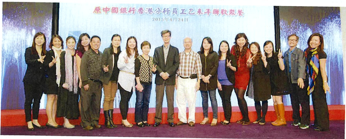
2015年4月24日，原港中行員工舉辦的乙未年聯歡聚餐（右二為作者）

我們不但服務香港社會發展，而且為建設社會主義國家而不斷壯大中資銀行實力。港中行後期也