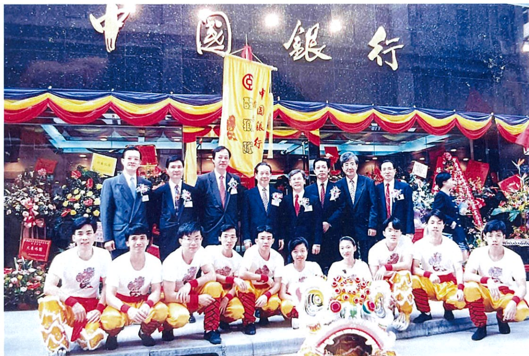
港中行慶祝支行開幕合照

限於個人水平，我僅僅是粗淺地談了下個人的經歷和感受，沒有總結我們港中行時期那些輝煌和亮麗的業績、業務策略等。一個企業發展的根基在於「人」，從港中行到中銀香港，百多年來無數前輩和同事默默奉獻，正是這一代代中銀人的同心同行和接續奮鬥，才奠定了中銀香港的宏大基業。我相信，百多年歷史的精神傳承，如浩瀚江海奔騰不絕；我更相信，總有一盞永不熄滅的明燈照亮著我們前行的道路，推動著中銀香港闊步前行。